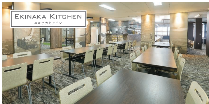
エキナカ キッチン