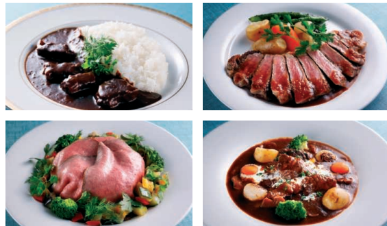
ダイニング「レイクビュー」(山頂駅隣接) 260席

山頂駅とびわ湖テラスに隣接するダイニング「レイクビュー」。シェフこだわりの近江牛メニューや、びわ湖テラスの逸品「びわ湖ブラックカレー」など、ゆったりとした空間でお楽しみいただけます。