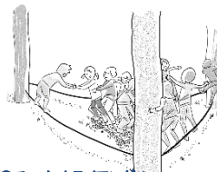
●チーム・トライアングル

チームで協力して課題に取り組んだプロセスや考え方、協力の過程を互いに話す事により自分達で気づき、成長を実感していきます。日常の活動に活かせる要素は？ファシリテーターはチームの「気づき」の支援を行います。