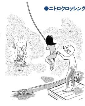
●二トクロッシング