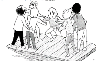
●ジャイアントシーソー