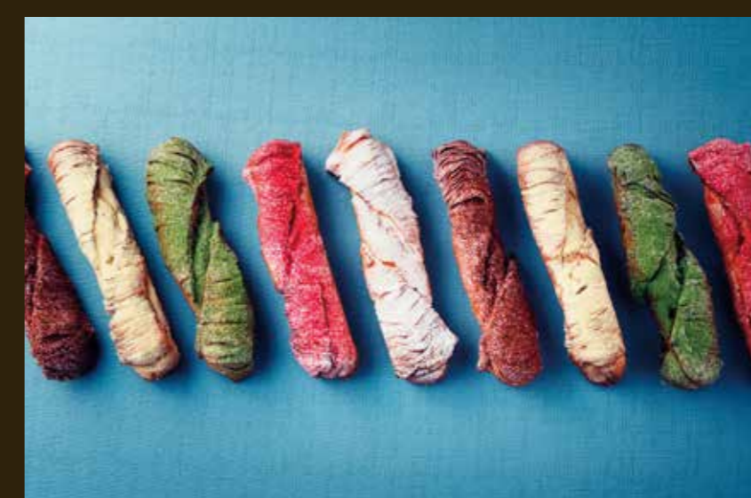
シューアラゴスタ

Chou Aragosta (Icing Sugar & Custard Cream/Matcha & Custard Cream/Raspberry & Strawberry/Custard Cream/Tiramisu/Lemon)