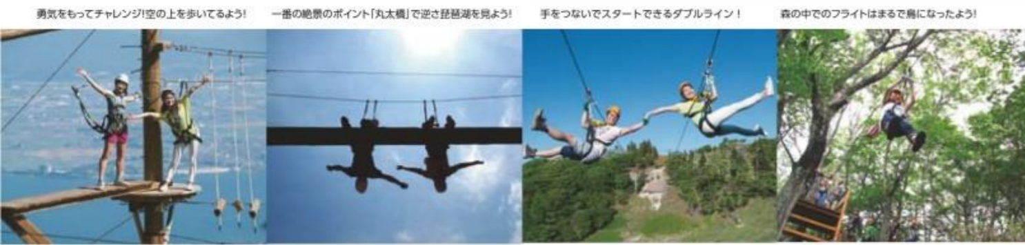
勇気をもってチャレンジ!空の上を歩いてよう! 一番の絶景のポイント「丸太橋」で逆さ琵琶湖をみよう! 手をつないでスタートできるダブルライン! 森中でのフライトはまるで鳥になったよう!